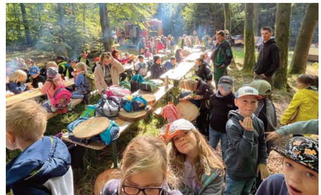
Picknick mit der Feuerwehr

derholen könnten. Aber wir können auch verstehen, wenn es nicht klappt, weil ja wirklich ganz viel Arbeit daran hängt!!